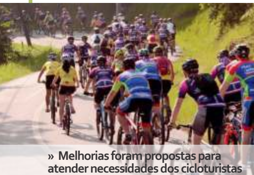
» Melhorias foram propostas para atender necessidades dos cicloturistas

O primeiro circuito oficial de cicloturismo do Brasil a envolver litoral e interior, o Costa Verde & Mar, foi atualizado. Os 255 quilômetros que integram paisagens rurais e litorâneas, passaram a contar com sete etapas. Uma das novidades