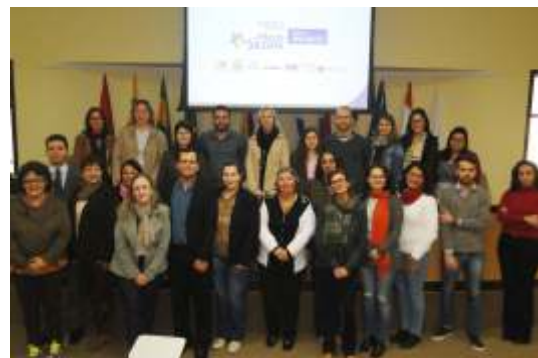
» Curso reuniu técnicos no auditório da AMFRI