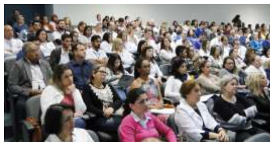
» Auditório lotado para prestigiar seminário

A AMFRI contribuiu com a divulgação, convidando mais de 400 instituições de educação dos municípios da região. A mobilização surtiu efeito, lotando o seminário. "O evento materializa o interesse e a ação do setor produtivo de SC com a educação pública e colabora para que a sociedade e a comunidade educacional discuta a ação da gestão escolar na qualidade de ensino", desta-