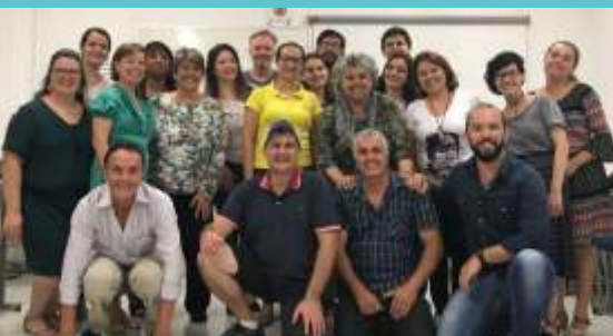
» Curso da AMFRI teve apoio da Univali