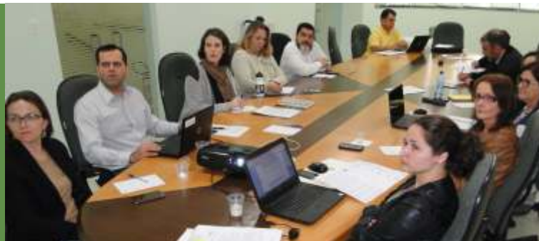
» Colegiado ligado a FECAM foi criado em 2014 e seu primeiro presidente foi assessor da AMFRI

O Escritório de Projetos da FECAM realizou em 26 de agosto, na sede da AMFRI em Itajaí, uma reunião com Assessores de Projetos das Associações de Municípios de SC. Na pauta da reunião esteve a avaliação das ações da Rede de Assessores de Projetos de Santa Catarina, dos cursos do programa SICONV, a aprovação do modelo de relatórios de controle e gestão de con-