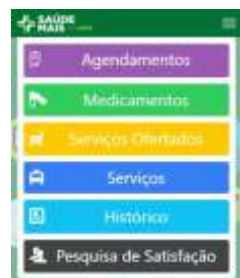
» Layout do App