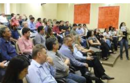
» Resultados de levantamento são resultado de vários encontros de técnicos municipais