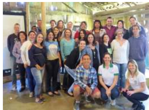
» No total, roteiro passou a ter 132 atrativos

Encontros: Foram realizados nos municípios de Balneário Piçarras, Bombinhas, Itajaí, Itapema, Luiz Alves, Navegantes e Porto Belo. Nos encontros, foram expostas as atualizações, o roteiro cultural e palestra sobre a importância do bom atendimento aos turistas. O objetivo principal foi aproximar os parceiros do roteiro, bem como prepará-los para a alta temporada, munindo-os com material de divulgação.