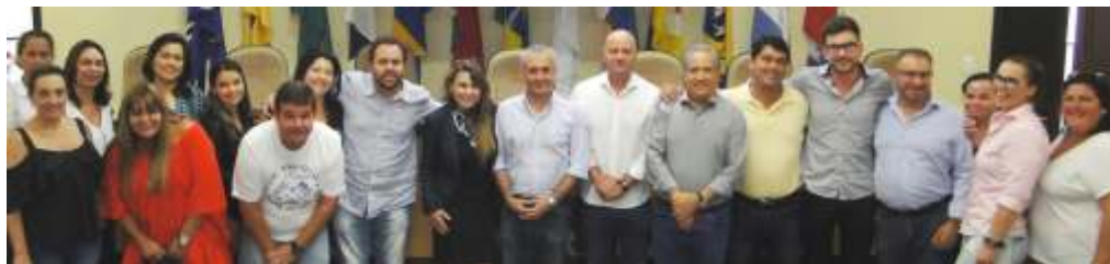
» Prefeitos atuais e eleitos e o secretário de Estado da Saúde Kleinubing estiveram presentes

Nos dias 31/10 e 21/11 foram apresentadas as duas partes do diagnóstico compactado da saúde na região, além de apresentar todo o SUS e suas normas nos municípios. Estiveram presentes na sede da AMFRI, além de autoridades da área, prefeitos atuais e eleitos para o mandato de 2017-2020 e o Secretário de Estado da Saúde, João Paulo Karam Kleinubing.