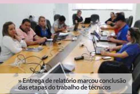
» Entrega de relatório marcou conclusão das etapas do trabalho de técnicos

Outro grupo que também concluiu suas atividades do ano foi dos responsáveis pelo Monitoramento dos Planos Municipais de Educação. Entre os principais temas debatidos e orientados estiveram o monitoramento e avaliação dos PMEs. As etapas do trabalho em regime de colaboração com o MEC foram concluídas com a entrega do relatório de atividades que aconteceu em 30/11.