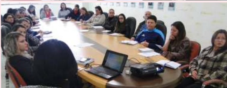
» Benefício da Prestação Continuada foi um dos temas tratados em reunião