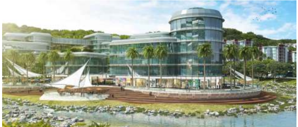
» Maquete digital das futuras instalações do Distrito Tecnológico de Inovação

A estratégia para alcançar o desenvolvimento regional tem seu ponto de partida na base industrial já existente, somada à qualificação da mão-de-