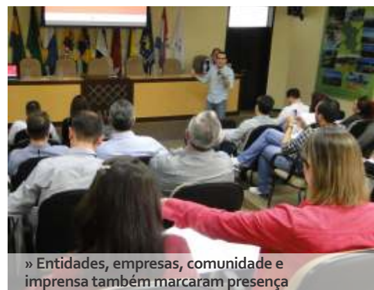
» Entidades, empresas, comunidade e imprensa também marcaram presença

O Plano Regional de Mobilidade Urbana também foi entregue e apresentado resumidamente. Entre as propostas estiveram: a abertura de vias entre as cidades, estruturando ligações intermunicipais; a implantação de um arco metropolitano, que seria uma estrada paralela a BR 101 ao qual serviria para desviar o tráfego regional de cargas; e a consolidação de um transporte coletivo regional transitando desde Bombinhas até Balneário Piçarras.