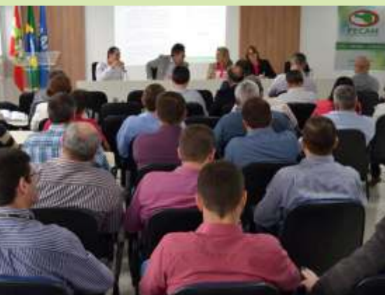
» Prefeitos destacaram a grave crise que passam e como a retenção de recursos agrava a situação

A solicitação de proposta foi feita presencialmente ao presidente do BADESC, José Caramori, que representou o Estado durante a Assembleia. A FECAM, representando os municípios catarinenses, também encaminhou formalmente uma solicitação apresentando a proposta ao governador Raimundo Colombo.