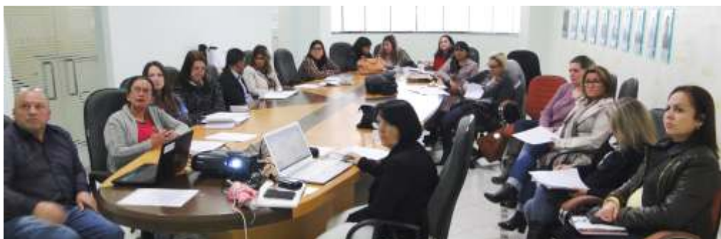
» Implementação da política de educação especial é foco do GT da AMFRI

Outro grupo que também realizou sete reuniões no último ano foi o Fórum Macrorregional Educação e Diversidade Etnorracial. O FOMEDE é voltado à articulação e discussão de