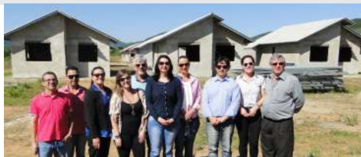
» Representantes municipais se surpreenderam com as obras

Na manhã de 15/09, o Colegiado de Habitação realizou uma visita técnica no município de Luiz Alves. O grupo ficou satisfeito com tudo o que viu in loco nas casas populares, considerando a visita muito produtiva.