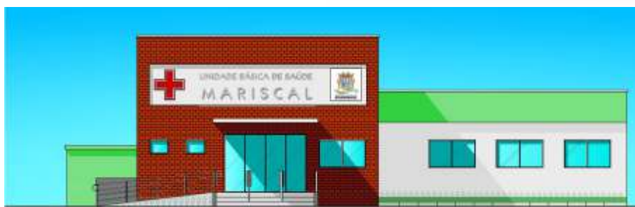
ELEVAÇÃO SUDESTE - (AVENIDA DIAMANTE)

Projeto executivo de ponte em concreto pre-moldado Extensão total de 45,00m R$ 1.215.107,17