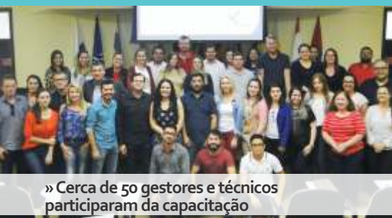
» Cerca de 50 gestores e técnicos participaram da capacitação