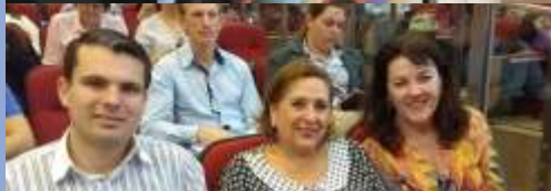
» AMFRI esteve representada no Fórum por gestores e técnicos de sete municípios da região