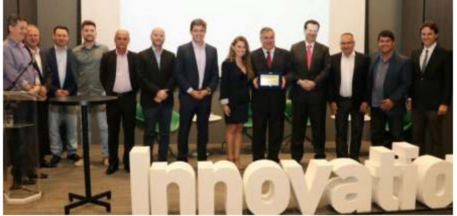
» Governador foi homenageado com placa entregue pela presidente da AMFRI

O InovAmfri é um projeto regional, com um planejamento de desenvolvimento econômico e social para os próximos anos, com a participação do Governo do Estado, da Amfri, apoio do Sebrae, da