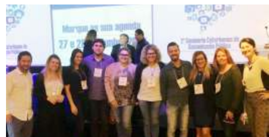
» Delegação da AMFRI ao lado de assessores da FECAM

Outra capacitação em que os integrantes do Colegiado de Comunicação Social estiveram foi o Curso de Imprensa e Comunicação promovido pela EGEM. O evento foi realizado nos dias 28 e 29 de setembro na Granópolis. Mostrando a preocupação com o aperfeiçoamento, a região da AMFRI foi a de maior representatividade com 11 assessores de comu-