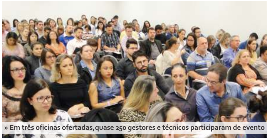
» Em três oficinas ofertadas, quase 250 gestores e técnicos participaram de evento

Com o objetivo de aproximar quem fiscaliza de quem aplica o dinheiro público, o Tribunal de Contas de Santa Catarina em parceria com a AMFRI promoveu no dia 27/7 a etapa regional do XVII Ciclo de Estudos de Controle Público da Administração Municipal. Mais de 240 pessoas participaram, entre vereadores, secretários, contadores, controladores internos e técnicos de recursos humanos e de licitações e contratos das prefeituras dos municípios da Foz do Rio Itajaí.