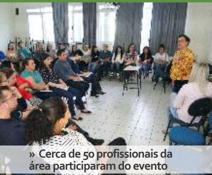
» Cerca de 50 profissionais da área participaram do evento

Com o objetivo de dialogar sobre a concepção de convivência e fortalecimento de vínculos no SUAS, profissionais da área da Assistência Social participaram nos dias 1 e 2 de agosto do curso. O evento foi conduzido pela renomada mestre e doutora em Serviço Social, Abigail Torres.