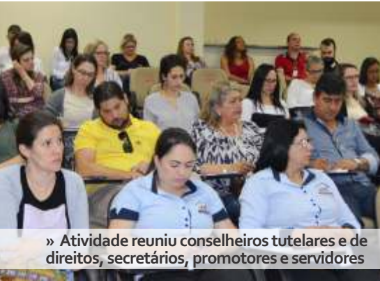
» Atividade reuniu conselheiros tutelares e de direitos, secretários, promotores e servidores

Conselheiros, secretários municipais de assistência social, promotores, representantes dos serviços de acolhimentos e trabalhadores do Sistema Único de Assistência Social (SUAS) estiveram no auditório da AMFRI durante todo o dia 24 de novembro. Os Serviços de Acolhimento para Crianças e Adolescentes foram o tema da roda de conversa promovida pela associação em parceria com a Federação Catarinense de Municípios - FECAM e o Ministério Público Estadual.