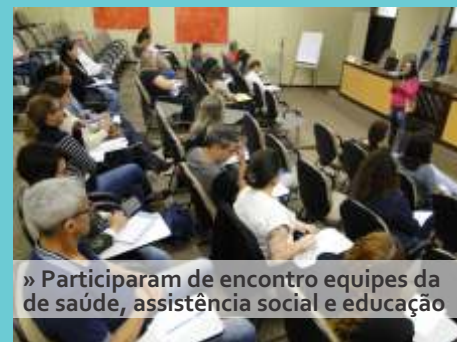
» Participaram de encontro equipes da de saúde, assistência social e educação

Capacitar equipe multidisciplinar para a atuação comprometida com a realidade da população em situação de rua foi objetivo do encontro. Equipes das áreas da saúde, assistência social e educação estiveram na sede da AMFRI no dia 30 de agosto para se aperfeiçoar mais sobre abordagem e condução. O evento ainda contou com a participação de pessoa que estão em situação de rua, que além de estarem procurando por ajuda estão em busca de entender melhor o sistema.