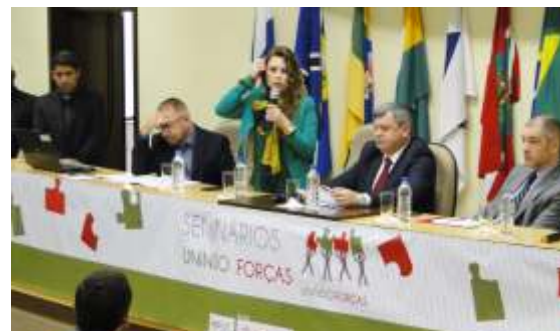
» Evento teve o objetivo de fortalecer o controle interno nas prefeituras