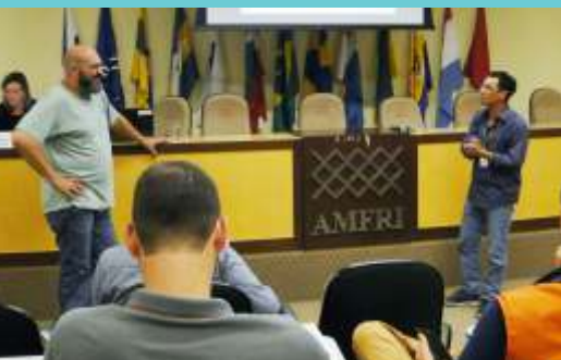
» Grupo reúne órgãos públicos, instituições de ensino e entidades civis

O CEPEDfri é um centro plural, cujos integrantes são instituições de ensino superior e técnico, instituições de pesquisa e extensão, entre outros que podem apresentar e desenvolver projetos considerados relevantes ao tema redução de riscos a desastres. Já integram o Centro, representantes das Defesas Cíveis dos municípios da AMFRI, UNIVALI, Instituto Federal Catarinense Campus Camboriu, COREDEC, UDESC, Associação Brasileira de Pesquisa de Redução de Riscos e Desastres, e Secretaria de Estado da Defesa Civil.