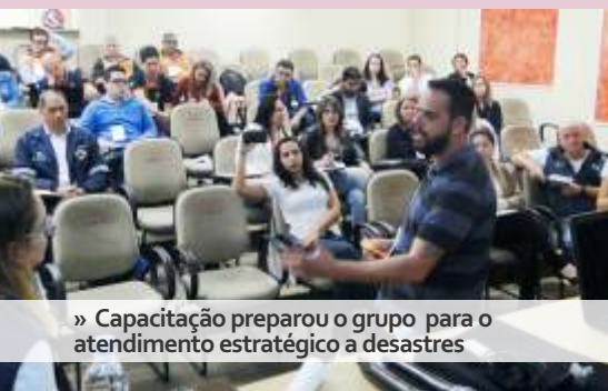
» Capacitação preparou o grupo para o atendimento estratégico a desastres