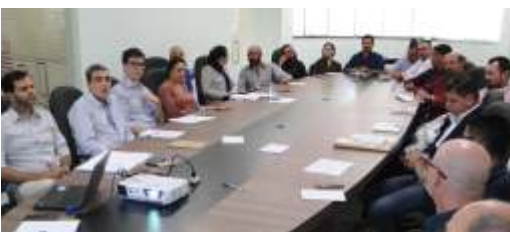
» Colegiado de Gestores de Convênios obteve informações sobre acessar recursos

Já no dia 18/10, o colegiado participou do 1º Seminário Regional de Captação de Recursos da Grande Florianópolis. O Seminário foi organizado pela Granfpolis, com o objetivo de apresentar aos gestores municipais as alternativas para acessar recursos através do planejamento de bons projetos e da diversificação das fontes de recursos.