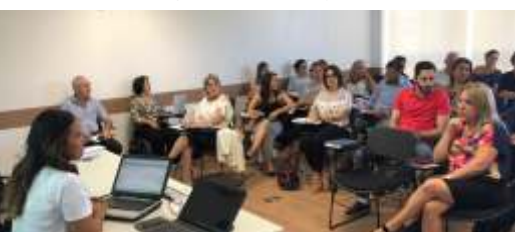
» Colegiado definiu o cronograma e calendário de atividades para 2018

A pauta extensa reuniu profissionais da área de todo o Estado na sede da Granfpolis. Durante o dia 27/2, a vice-presidente do Colegiado de Educação da AMFRI, Profª