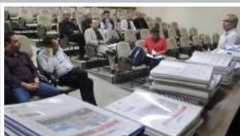
» Ação teve objetivo de disseminar as informações nos municípios da região.

Já no começo do ano, em 29/1, foi realizada uma audiência pública para esclarecer dúvidas sobre a construção do Distrito Regional de Inovação de Itajaí. Durante o encontro no salão do Parque do Agricultor, cerca de 70 participantes conheceram o Relatório de Impacto Ambiental, apresentado pela Itajaí Participações, que acompanha o andamento do processo. O InovAmfri é um projeto de desenvolvimento regional, pioneiro no Brasil, que conta com o apoio do Governo do Estado de SC.