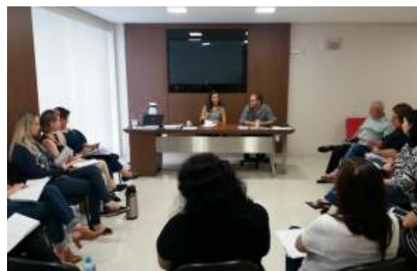
» Colegiados regionais de assistência social se reuniram dia 8 de maio, em Florianópolis.

Os Colegiados Regionais de Assistência Social, em parceria com o Centro de Apoio Operacional da Infância e Juventude do MP/SC, debateram a Lei da Escuta Especializada e do Depoimento Especial, que entrou em vigor em 4/4/2018. A proposta encaminhada pelo Colegiado é de que em parceria com os órgãos sejam realizadas capacitações presenciais, além de uma capacitação a distância oferecida pelo MP.