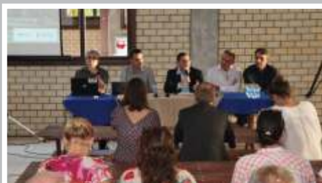
Os impactos do Distrito Regional de Inovação de Itajaí foram apresentados.