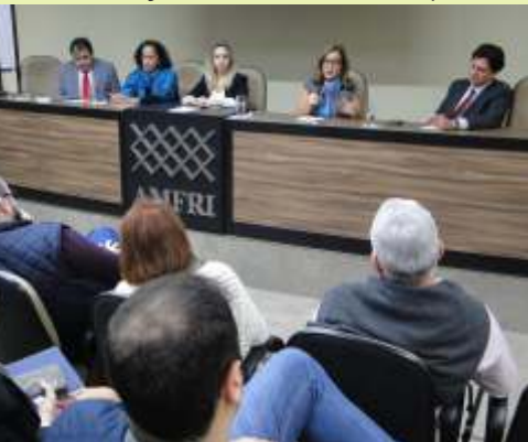
» Encontro mostrou possibilidades de financiamento e gestão de empreendimentos na área da saúde

A AMFRI e o Consórcio Intermunicipal de Saúde (CIS-AMFRI) promoveram em 19 de maio a I Conferência da região sobre PPP na Saúde. Gestores das áreas de administração e saúde, assim como procura-