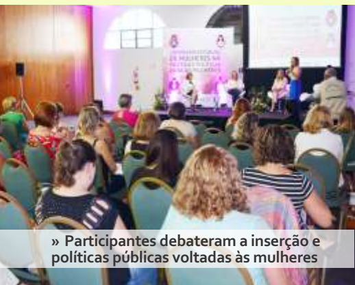
» Participantes debateram a inserção e políticas públicas voltadas às mulheres

Cerca de 100 pessoas reuniram-se em 15/3, para discutir os espaços de empoderamento político feminino no I Seminário Estadual de Mulheres na Política e Políticas para as Mulheres. O evento foi promovido pela FECAM, com o apoio da prefeitura de Bombinhas e AMFRI, e a organização da EGEM.