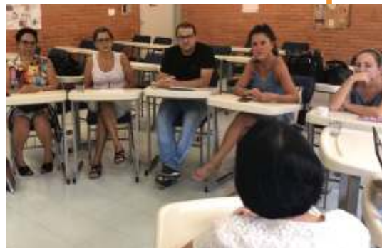
» Atividades conjuntas entre as entidades irão auxiliar a aperfeiçoar práticas pedagógicas