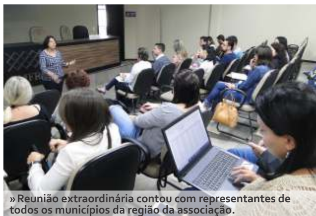
» Reunião extraordinária contou com representantes de todos os municípios da região da associação.

Em 21/2, os integrantes do GT do PAR também estiveram reunidos. Dois motivos essenciais conduziram o encontro, a análise do manual de gestão da prestação de compras do PAR 2011-2014 e a realização do preenchimento do planejamento do PAR 2017-2020.