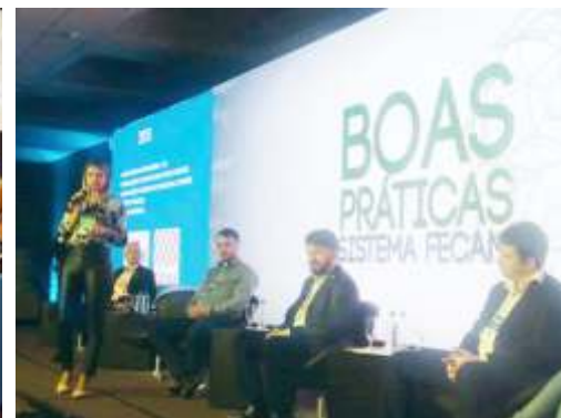
» Um dos destaques foi o Colegiado de Gestão em Educação dos Municípios da Foz do Rio Itajaí.

cação também aconteceu no Centro-Sul, em Florianópolis. Representantes do setor de toda Santa Catarina foram apresentados a casos de sucesso. "Apresentamos a estrutura, a metodologia e as ações que os dois ADEs do