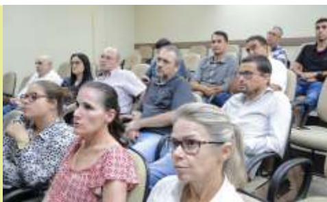
» Representantes da empresa Agiprev explicaram o processo, totalmente eletrônico

Na reunião, foi demonstrado o módulo da fiscalização eletrônica para o "Simples Nacional", ISS, cartões e leasing, ins-