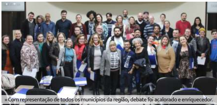
» Com representação de todos os municípios da região, debate foi acalorado e enriquecedor.

Em seguida os participantes assistiram a duas palestras com importantes representantes da área. A primeira "Por uma gestão democrática de cultura: o papel do