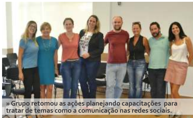
» Grupo retomou as ações planejando capacitações para tratar de temas como a comunicação nas redes sociais.