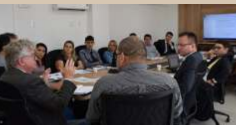
» Onze Associações de Municípios estiveram na FECAM para a reunião.

Encontro foi realizado em 13/3, em Florianópolis. Ferramenta de gestão do Tribunal Regional Federal, Emendas Constitucionais que tratam sobre o levantamento dos depósitos judiciais para os municípios optantes