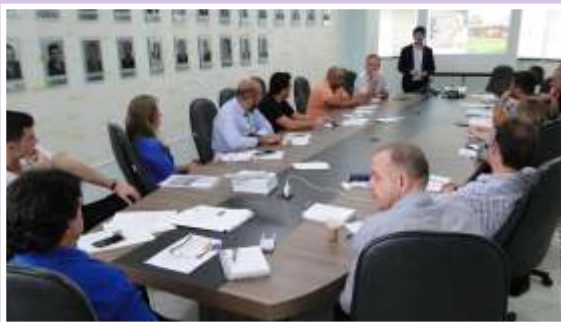
» Colegiado estuda nova lei que obriga município a arcar com toda a infraestrutura

Durante todo o semestre uma das prioridades do Colegiado de Habitação foi tratar da Lei de Regularização Fundiária. Em 15/2 o principal objetivo foi esclarecer sobre a nova lei que desburocratiza o tema. Além dos secretários e técnicos dos municípios, representantes da empresa Versal Engenharia e Consultoria Ltda estiveram presentes para tratar do assunto.