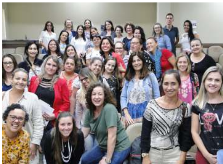
» Participam cerca de 90 profissionais, principalmente trabalhadores que atuam nos serviços e equipes de gestão.

Em todos os dias foram realizados diálogos, dinâmicas em grupos para aprofundar os entendimentos sobre as demandas, necessidades e serviços do SUAS.