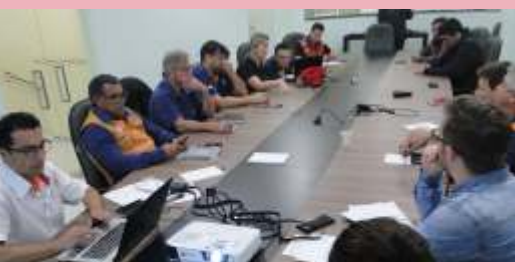
» Equipes da Defesa Civil, AMFRI, curso técnico da área do IFC e Coordenadoria Regional de Defesa Civil atuam unidos.

É importante os municípios desenvolverem e aprovarem em suas Câmaras de Vereadores o PAM, para que dentro de uma necessidade, principalmente em uma situação de emergência ou calamidade pública, um município possa ajudar o outro, sem ocorrerem ônus. Também foi tratado nas reuniões do colegiado sobre o Sistema Integrado de Proteção e Defesa Civil (SisDC), que os municípios já podem utilizar.