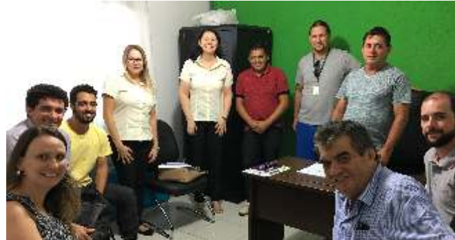
» Prefeitos e secretários esclareceram dúvidas e compartilharam informações sobre sistema de gestão

O sistema tem por objetivo padronizar e fortalecer os Serviços de Inspeção Municipal (SIM), regularizando as indústrias de produtos de origem animal, com foco na segurança alimentar das comunidades e no incremento econômico para a região. O resultado das visitas foi muito positivo, demonstrando que usar o sistema está permitindo uma série de melhorias nos SIM, e tornando a comercialização desses produtos mais segura para a comunidade.