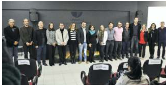
» AMFRI é a primeira região do Brasil a assinar protocolo da ONU

Os participantes estiveram atentos a todas as atividades, principalmente a palestra do renomado Capitão Americano, Charles Moore que com suas pesquisas comprovou o quanto resíduos de plástico contaminam nossos oceanos e prejudicam a todos.