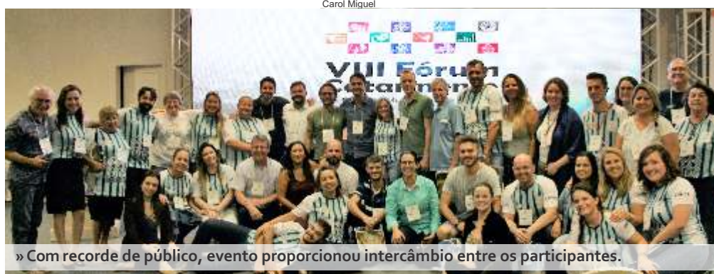
» Com recorde de público, evento proporcionou intercâmbio entre os participantes.

Foi entregue o Prêmio de Boas Práticas Culturais, dando visibilidade a ações