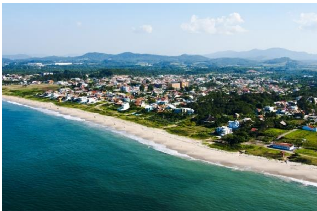
Figura 3: Imagem aérea e atual do município.

A análise do IDH de Balneário Piçarras ainda mostra que o município recebeu nota 0,668 no quesito educação, que é considerada média. Através do Censo 2010 (IBGE, 2010a) pode-se identificar que 4,54% da população ainda é analfabeta.