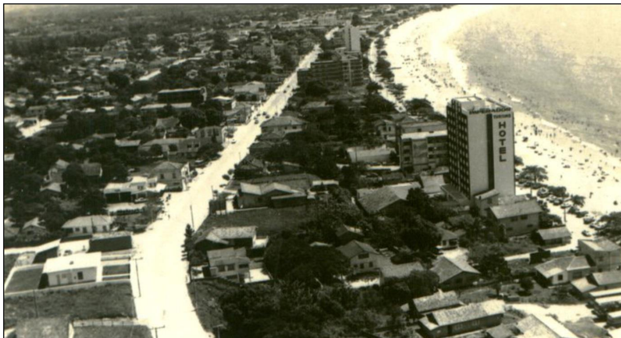
Figura 1: Imagem do município em meados dos anos 1970.

na região, tendo como resultado a miscigenação que hoje caracteriza a população da região (SILVEIRA, 2001).